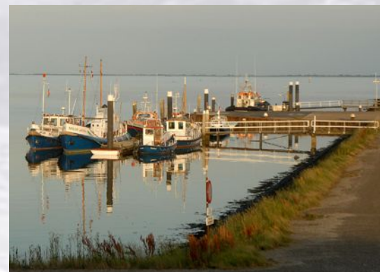
Museumhaven Zeemanshoop in de Ballumerbocht.